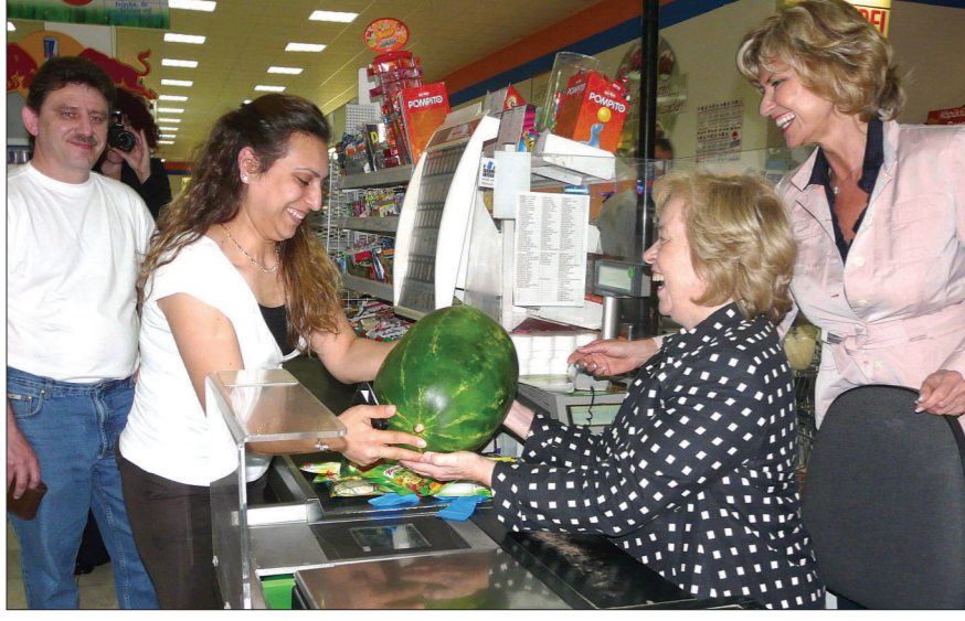
Bir ara kasaya geçip müşteri hizmeti sunan Bakan Böhmer, 7 kilogramlık bir karpuzu kasaya kaldırmakta zorlanınca, bir bayan müşteri kendisine yardım etti.